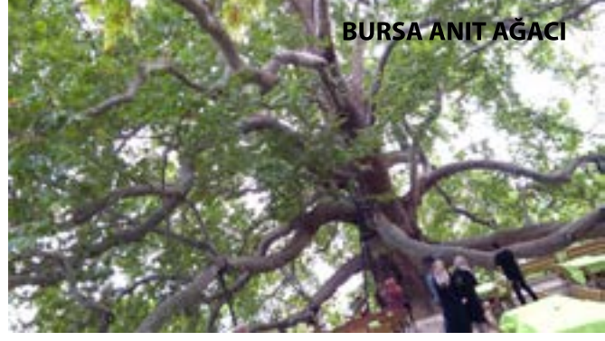
BURSA ANIT AĞACI

Osmanlı'nın ilk başkenti Bursa'dan ayrıldık ve Çanakkale'ye yol aldık.