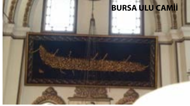
BURSA ULU CAMİİ